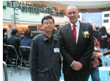
罗先生与 eXTV 行政总裁合影