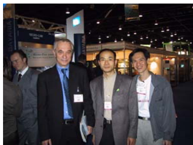
阿敏、越南阿丰与国际卫星杂志的天线博士合影